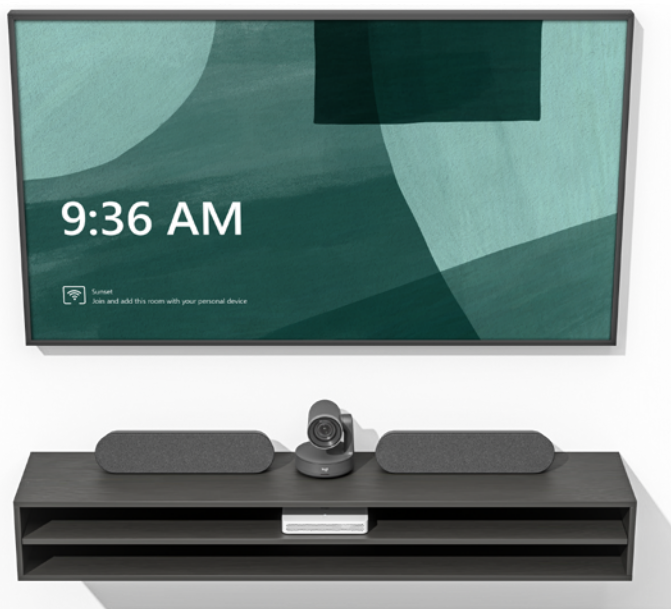
Logitech RoomMate con il sistema Rally Plus